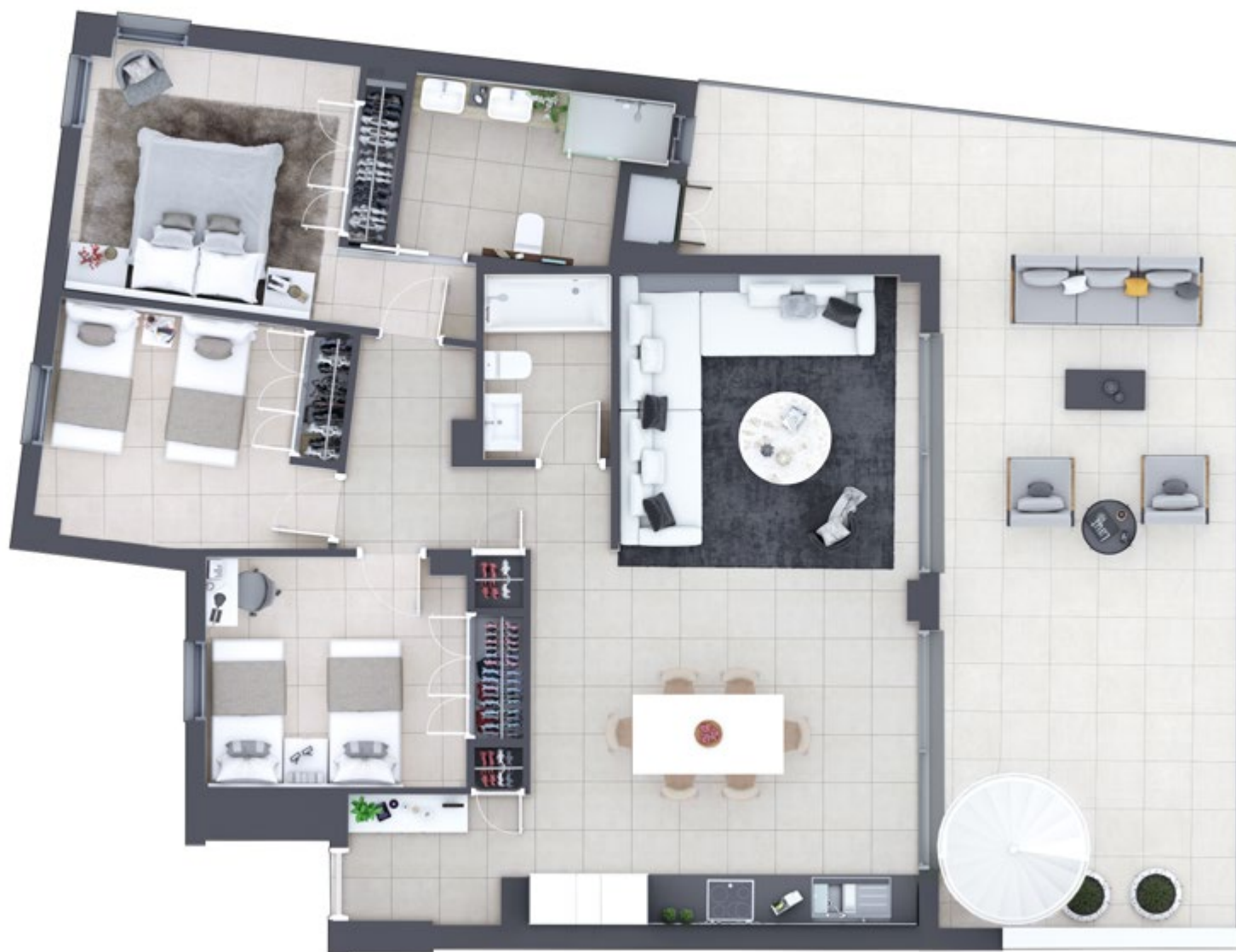
DISTRIBUCIÓN PARA 3 DORMITORIOS