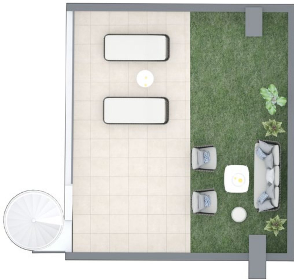
SOLÁRIUM - DISTRIBUCIÓN PARA 2 DORMITORIOS