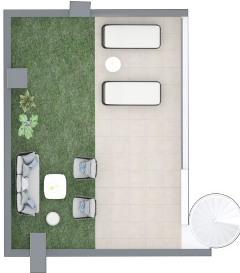
SOLÁRIUM - DISTRIBUCIÓN PARA 3 DORMITORIOS